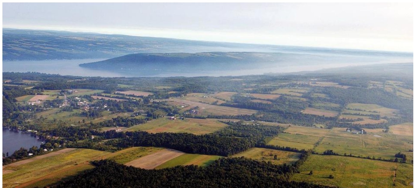
L'Etat de New York a un riche passé viticole. On y fait du vin depuis le 17e siècle.